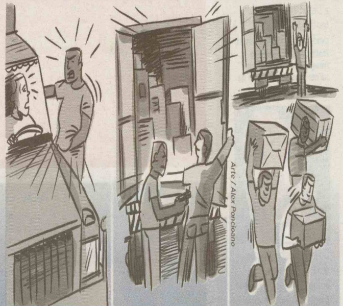
O motorista conduzia o caminhão com mercadorias quando foi abordado por um marginal.