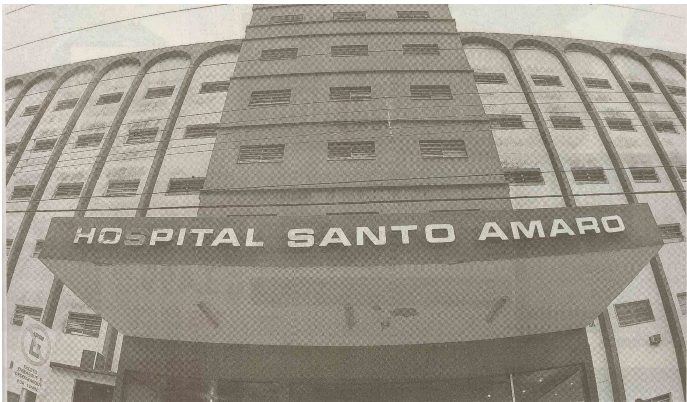
Hospital é o único de Guarujá que atende pelo Sistema Único de Saúde (SUS), em Guarujá, o que preocupa a Secretaria Municipal de Saúde