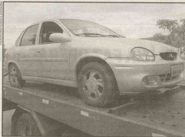
O suspeito estava ao lado do Corsa prata, que foi apreendido

O assalto ocorreu dentro do supermercado, que fica na Avenida Santos Du-